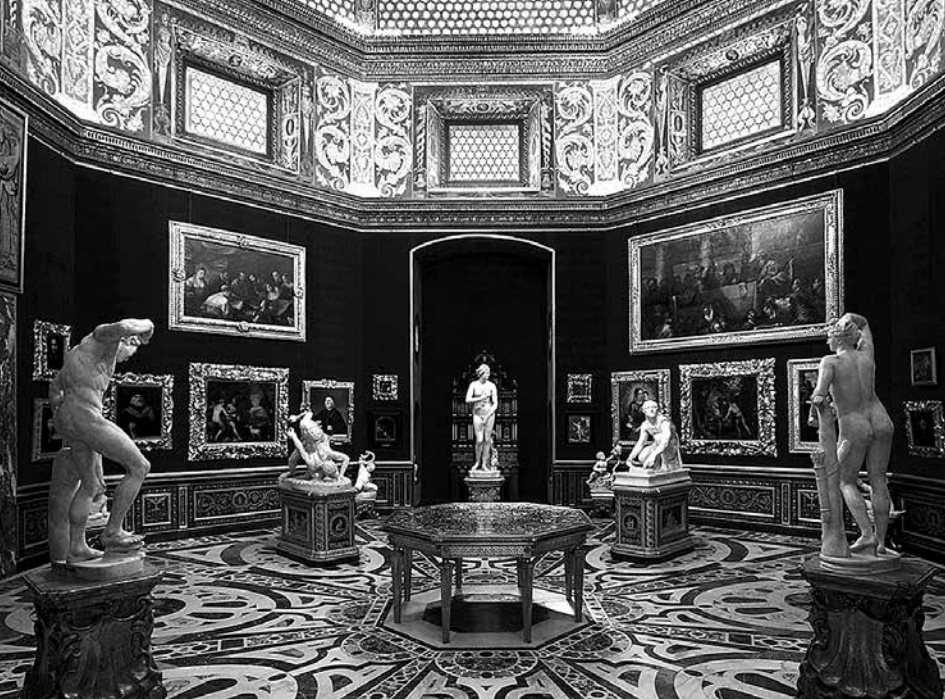
Зал «Трибуна» в галерее Уффици. В глубине — Венера Медицейская

Осмотревши Уффици, гости перешли в Палаццо Питти ( “он соединен с галереею и Старым дворцом переходами” ). Среди множества находящихся здесь произведений живописи Н. А. Демидов особенно выделил “Мадонну сидящую” Рафаэля Санти: