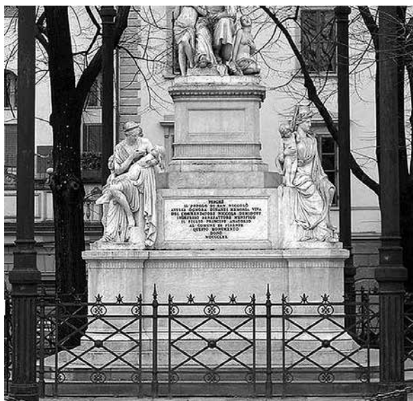
Памятник почетному гражданину Флоренции Николаю Никитичу Демидову на площади его имени.