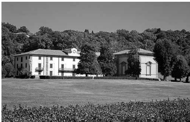
Вилла Демидовых Пратолино под Флоренцией

вые столовые, ночлежные приюты. В 1872 г., уже будучи вторично женатым на княжне Елене Петровне Трубецкой (дочери санкт-петербургского предводителя дворянства), он приобрел поместье Пратолино, в двадцати километрах от Флоренции по старой болонской дороге.