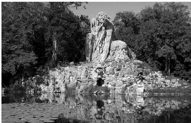
Скульптура Джамболоньи “Аллегория Апеннин” (“Колосс”) в парке виллы Пратолино

мечательностью парка виллы Пратолино продолжает оставаться грандиозная скульптура Джамболоньи “Аллегория Апеннин”.