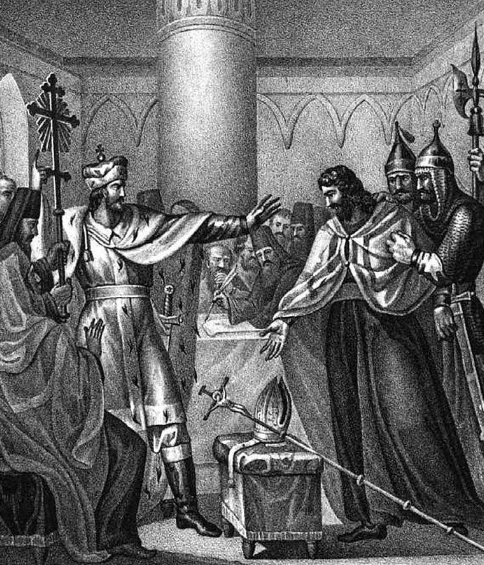
Великий князь Василий II отвергает Флорентийскую унию.