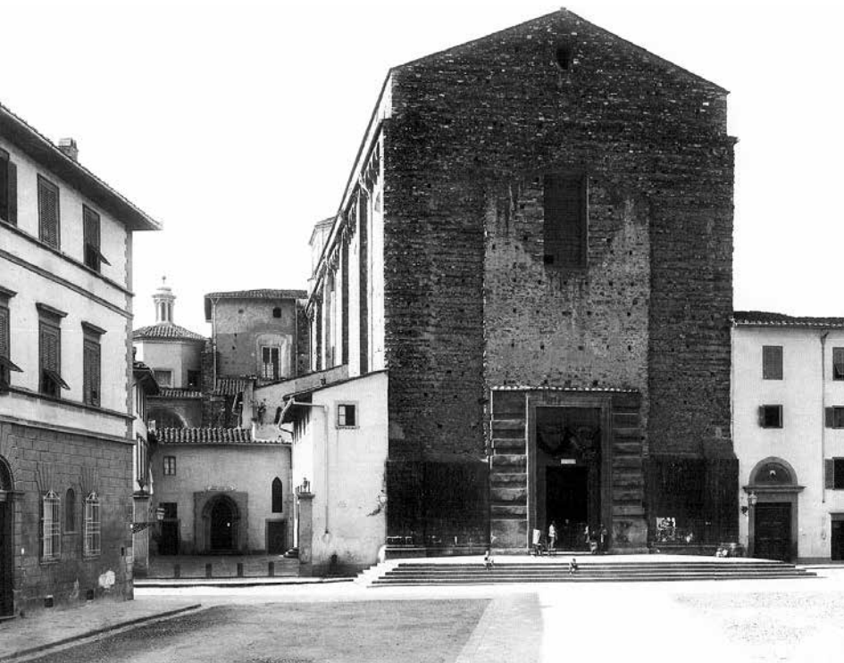
Церковь Санта-Мария дель Кармине.

“В этом же преименитом городе Флоренции в церкви Вознесения в четверг шестой недели после Пасхи, в самый этот праздник латиняне воспоминание творят в подобие древности, когда Иисус Христос в сороковой день вознесся со славой к отцу на небо. Посередине этой церкви есть помост, на левой стороне помоста устроен небольшой город каменный, чудный очень, с башнями и