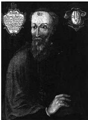
Исидор, Митрополит Киевский и Всея Руси.

1439 г. он отправился на Русь через Венецию; затем морем до хорватского берега; отсюда через Загреб, Будапешт и Краков в Литву. Из Вильны Исидор ездил в Киев, где Киевский князь Александр Владимирович дал “отцу своему Сидору” особую грамоту, которой подтверждались все права митрополита в “области киевской”.